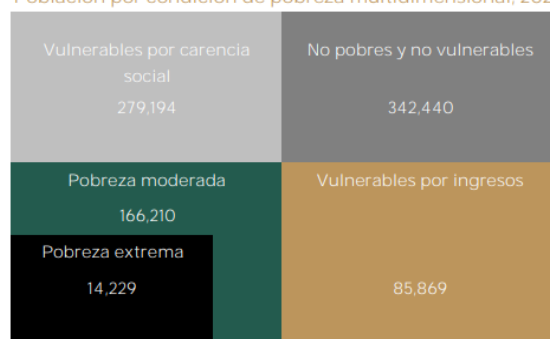
Población por condición de pobreza multidimensional, 2020 5